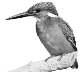
„Notfall“-Codes Familien-Rallye „Eisvogel“