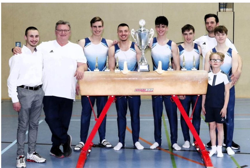
Team der KTV Ruhr-West feiern ihren Erfolg als Oberligasieger 2024