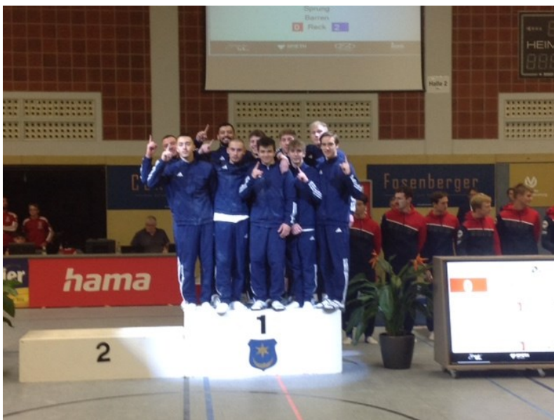
KTV schafft Aufstieg in die 2. Bundesliga