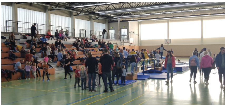
Tag des Kinderturnens