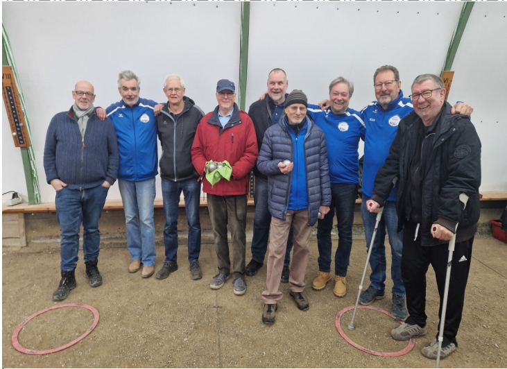
Boule Team 2