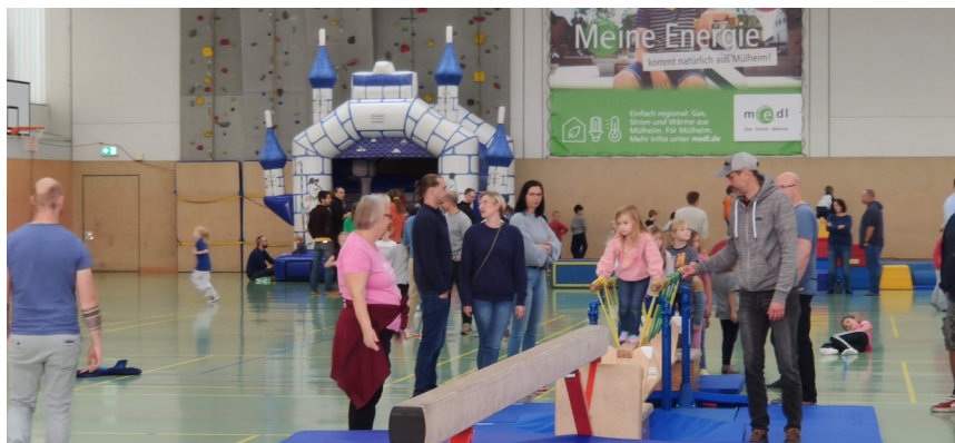
Spiel- und Sportfest 2023