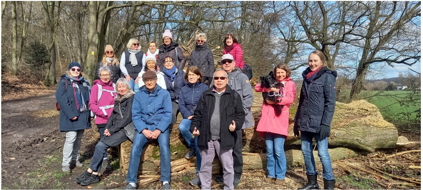
Teilnehmer am Wandertag